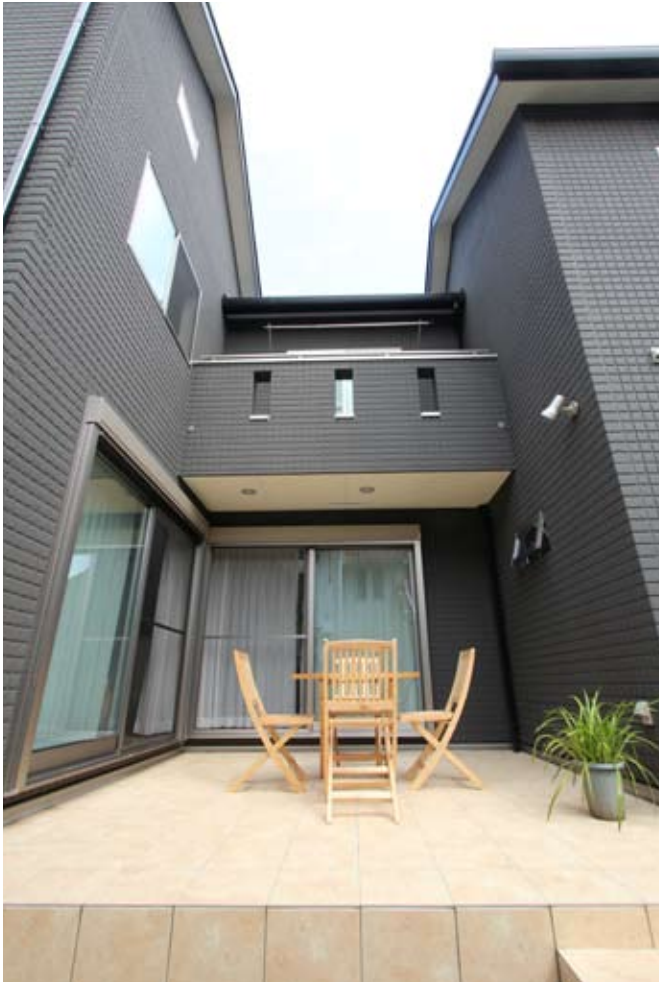
室内の採光に大きく貢献するパティオ（中庭）。夏にはバーベキューも楽しい。