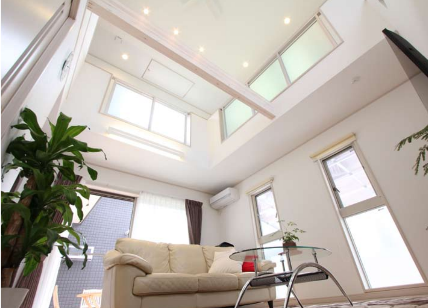
吹き抜け部を見上げる。リビングの照明は吹き抜け上の埋め込みのスポットと間接照明のみ。それでも夜は十分明るい、とご主人。