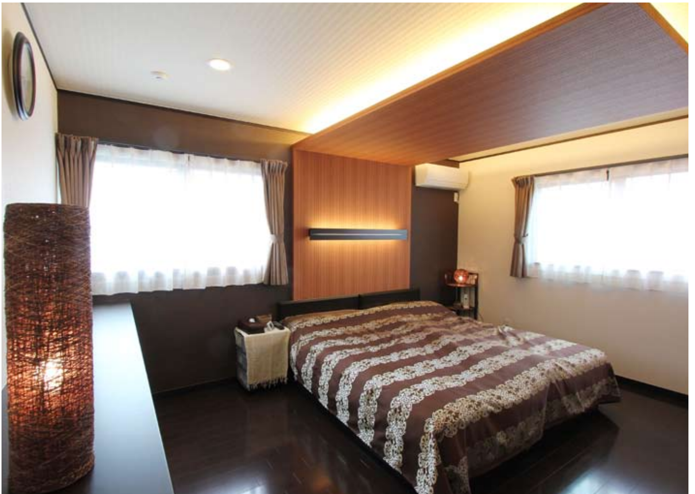
フローリングのトーンを落とし、間接照明を活用してシックに仕上げられた主寝室。左手造作収納の裏にはウォークインクロークも併設し、大容量ながらスッキリとした空間に。