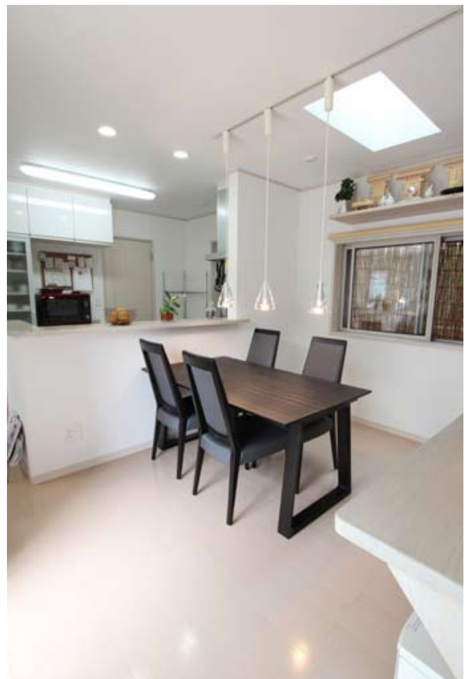
キッチンバックカウンター側から玄関ホールへ。最短の動線を確保する秀逸なレイアウト。