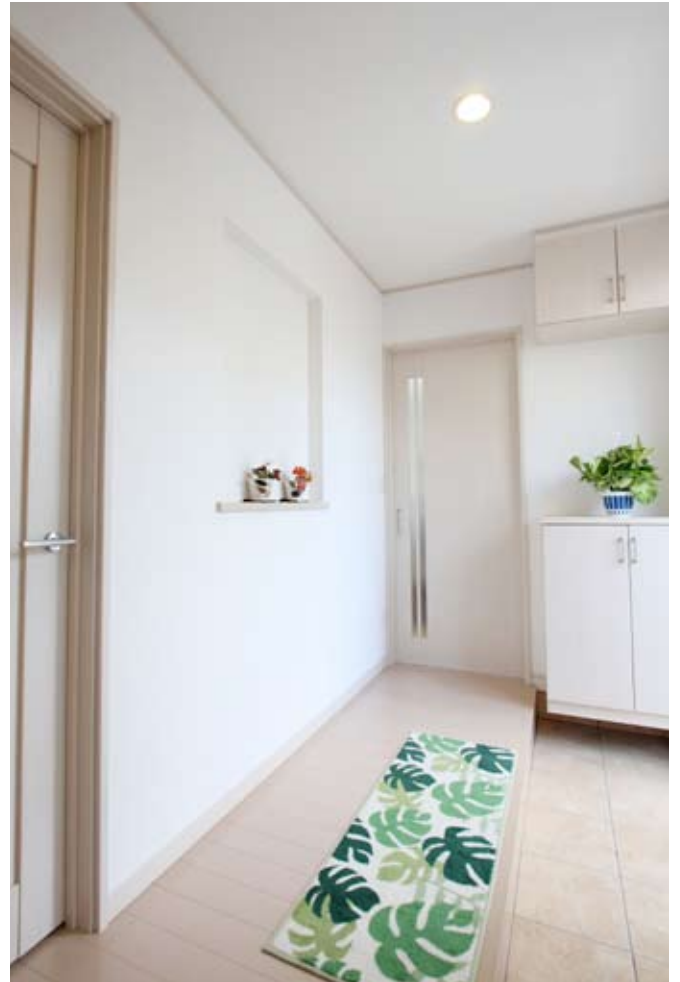
玄関ホール右手からはリビング、左手からはキッチンに直接アプローチできる、最短の動線。