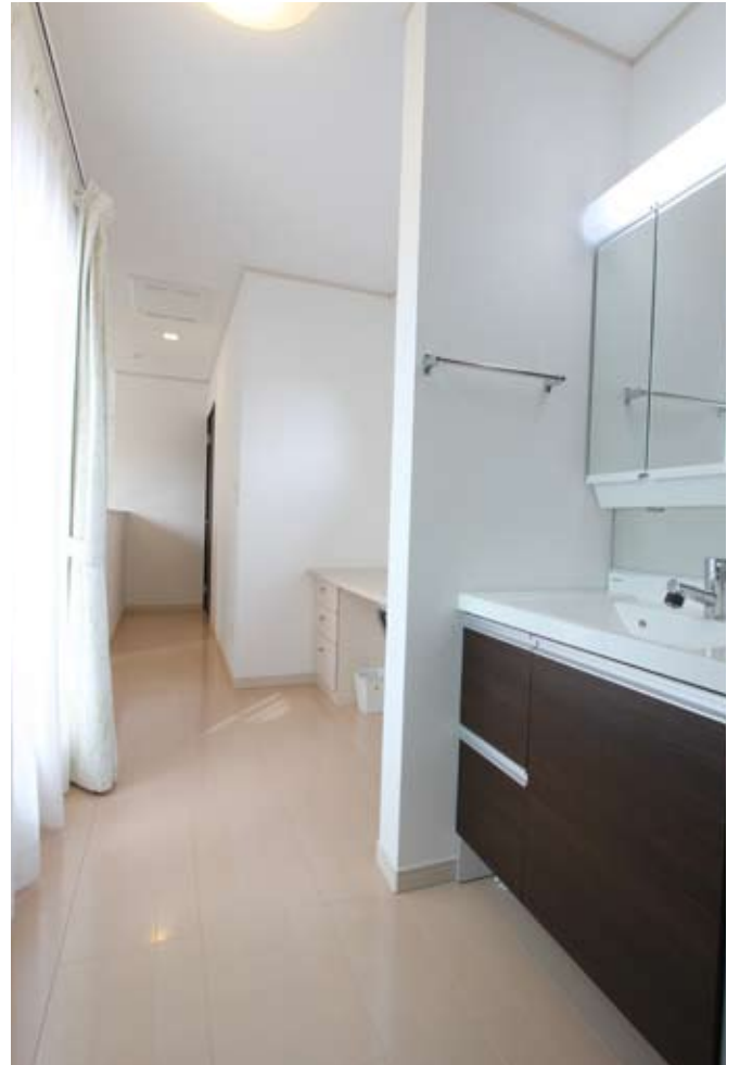
パティオ上部の主寝室に続くホールにはユーティリティスペース、洗面、トイレが効率よくレイアウト。