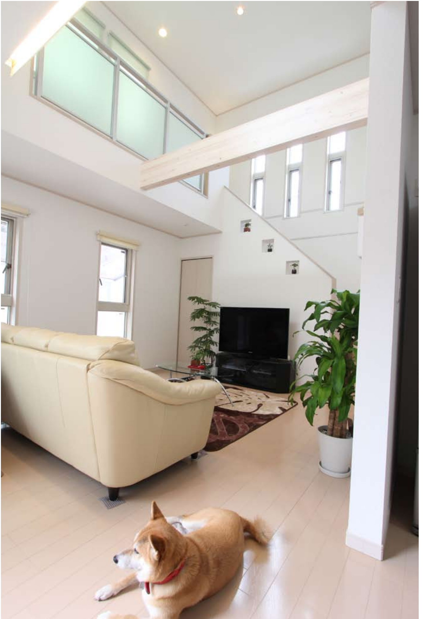
吹き抜け・リビング階段・採光窓の配置や白を基調とした設えなど、あらゆる工夫を施しとても北向きとは思えないほど明るい雰囲気の中のリビング。