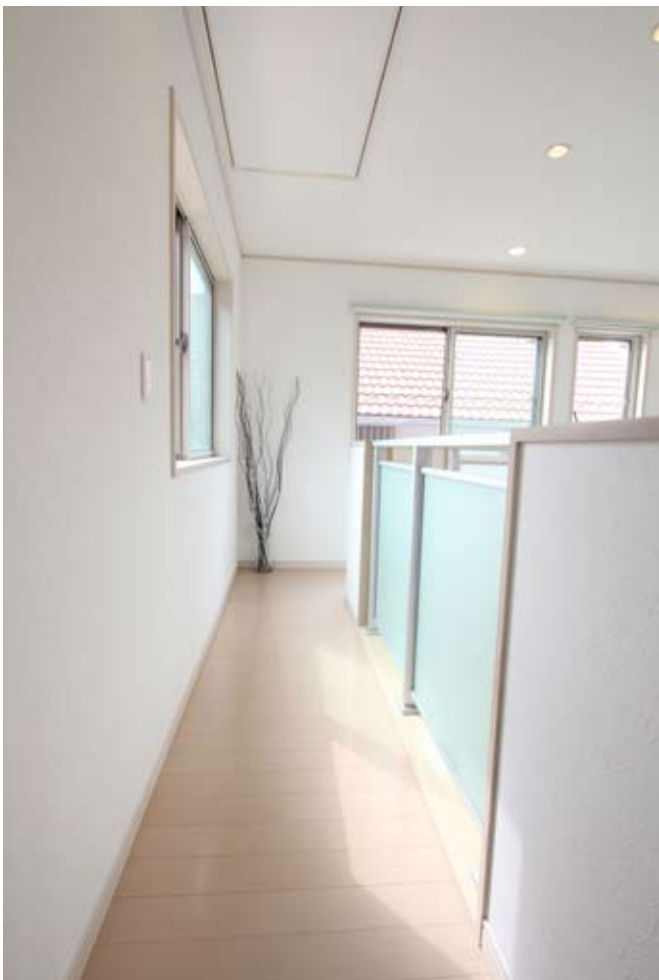
吹き抜けの壁際に沿うように造られた2Fへの明るいアプローチ。上部にはロフト収納の階段が。